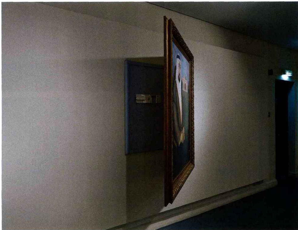
BIENNALE DE SHARJAT, 2009

On dit souvent qu'une terre ne vit que par le regard qu'on lui porte. Alors pas facile de trouver la vie de ce côté-ci du planisphère tant le monde semble n'y entrer que par effraction. En accélère. En précédant l'instant. Il y a du pays ou l'on n'arrive jamais dans les Émirats, et du Sisyphos à vouloir les figer dans un portfolio. Les pages à peine tournées, ceux-là ne seront déjà plus les mêmes. Une nouvelle tour viendra gratter leurs cieux, une île sortira de leur mer, la neige tombera à l'air conditionné d'un de leurs malls et puis un autre quartier, encore un palace, plus loin, des hippodromes, des circuits automobiles, un peu du Louvre, une aile de la Sorbonne, Tiger Woods swinguant au creux des dunes et, allez savoir, dans la minute suivante, peut-être la bibliothèque d'Alexandrie,