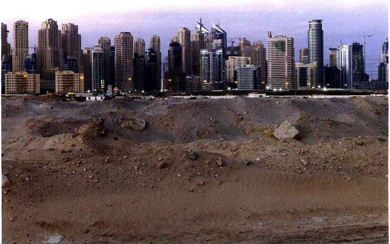
EMIRATES RING, DUBAI, 2008.

Ur, les écuries d'Augias, la face cachée de la lune. Au trou de serrure de Dubai, encore plus fou ! Si New York est ville debout, Paris ville lumière, Jérusalem ville sacrée, Dubai figure la ville pressée. Pressée d'elle même comme de son temps. Aussi mouvante qu'insomniaque. D'où le malentendu qui voit certains atfranchir les lieux au visa des pathétiques. Monde dérisoire, disent ils ! Artificiel, indécent, égaré entre nulle part et pétrodollars, désert et vulgaire. Une hystérie climatisée... Comme souvent, la vérité est pourtant ailleurs. Pas plus que d'autres, les Émirats n'ont choisi leur époque et si les pyramides eurent leurs pharaons, les cathédrales leurs rois, Las Vegas sa mafia, cette péninsule que l'on dit arabique n'a hérité, elle, que de ses émirs. Ni mieux, ni pires. Devinant un sous-sol qui ne cracherait pas