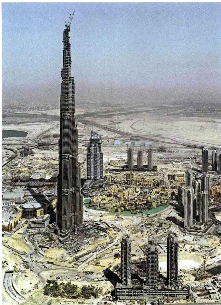
BURJ DUBAI, DUBAI, 2008

éternellement l'or noir qui les trouva prospères au siècle dernier, ces princes made in pétrole cherchent soudain la verticale d'un autre destin au prétexte d'un troisième millénaire louvoyant les loisirs et les tertiaires. Les Emirats ? Une terre directement passée des puits d'entrailles aux palaces hérissées, des pleins de super aux folies de l'hyper Hyper luxe, hyper ludique, hyper moderne et, désormais, plus d'autre mesure que la démesure. Le délire éruptif, l'utopie réalisée. Du coup,