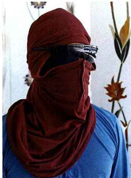
EMIRATES WORKERS ABU DHABI, DUBAI, SHARJAT, AJMAN, FUJAIRAH, RAZ EL KHALMAH, OUMM AL QAIWAIN, 2007-2009.