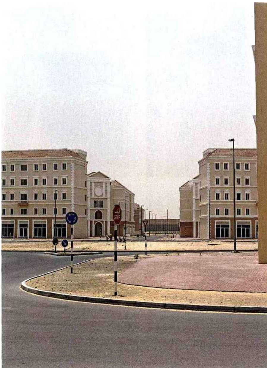
AL BARSHAA DISTRICT, DJEBEL ALI, 2007

la beauté d'ici, ou prétendue telle, n'est pas celle qu'on voudrait nous faire croire. Loin des bleus trop bleus, des lumières trop électriques, des shopping so bling, des piscines en manucure et des palmiers si lisses, prière de la classer plutôt dans l'énergie des hauts chantiers. Une volupté sismique, le charme des démesures. Aux âmes vraiment voyageuses, les palaces offrent alors des panoramas bien plus rares que ceux dépliés sur les plaquettes touristiques. Ici, en vérité, chambres avec vue sur grands travaux,